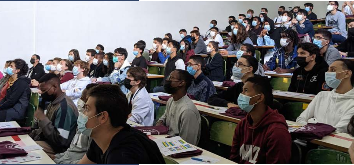
Découverte de l'IUT pour la première promotion du BUT GEII 1