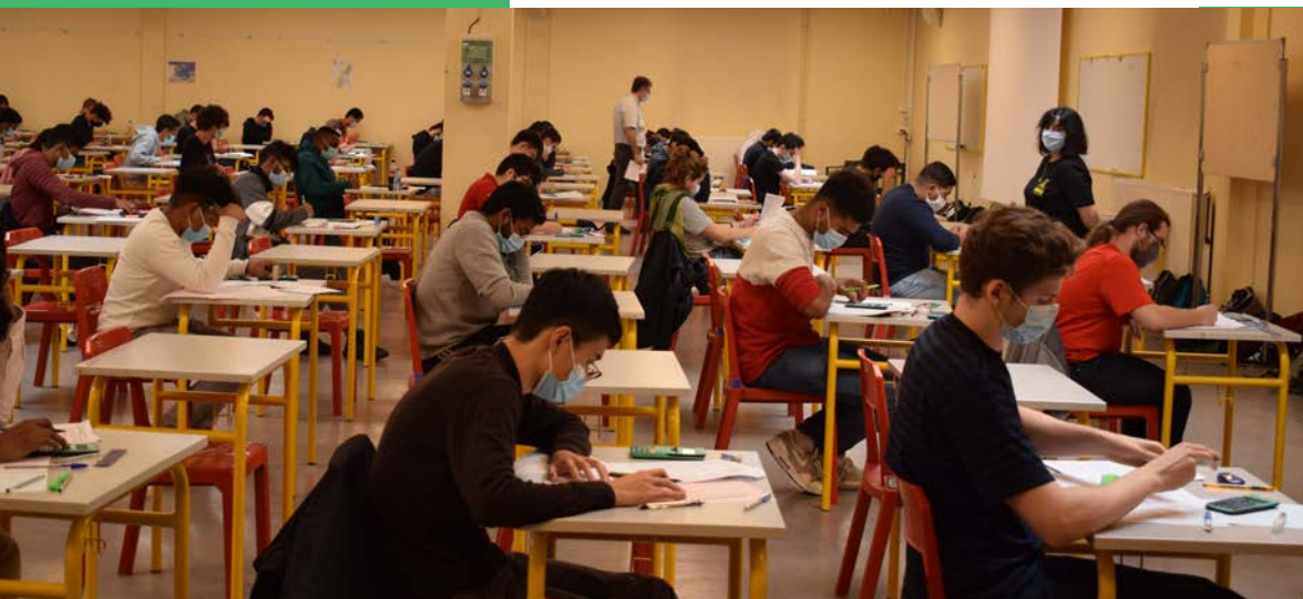
Salle des DS - Septembre 2020